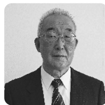
八雲町社会福祉協議会